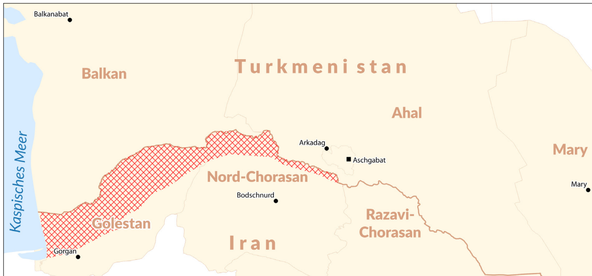
Karte 1: Das Grenzgebiet zwischen Iran und Turkmenistan mit iranischer Turkman Sahra – heutige administrative Gliederung

Das kreuzweise schraffierte Gebiet ist das ungefähre Gebiet der iranischen Turkman Sahra nach heutigem Verständnis.