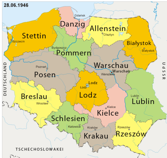
Karte 4: Die polnischen Woiwodschaften 1946

Quelle: http://pl.wikipedia.g-webs.com/w/index.php?title=Plik:POL SKA_28-06-1946.png&filetimestamp=20090428071830 ; erstellt von »Aotearoa«, Übersetzungen von Ländernamen und Woiwodschaftsbezeichnungen durch die Redaktion der Polen-Analysen.