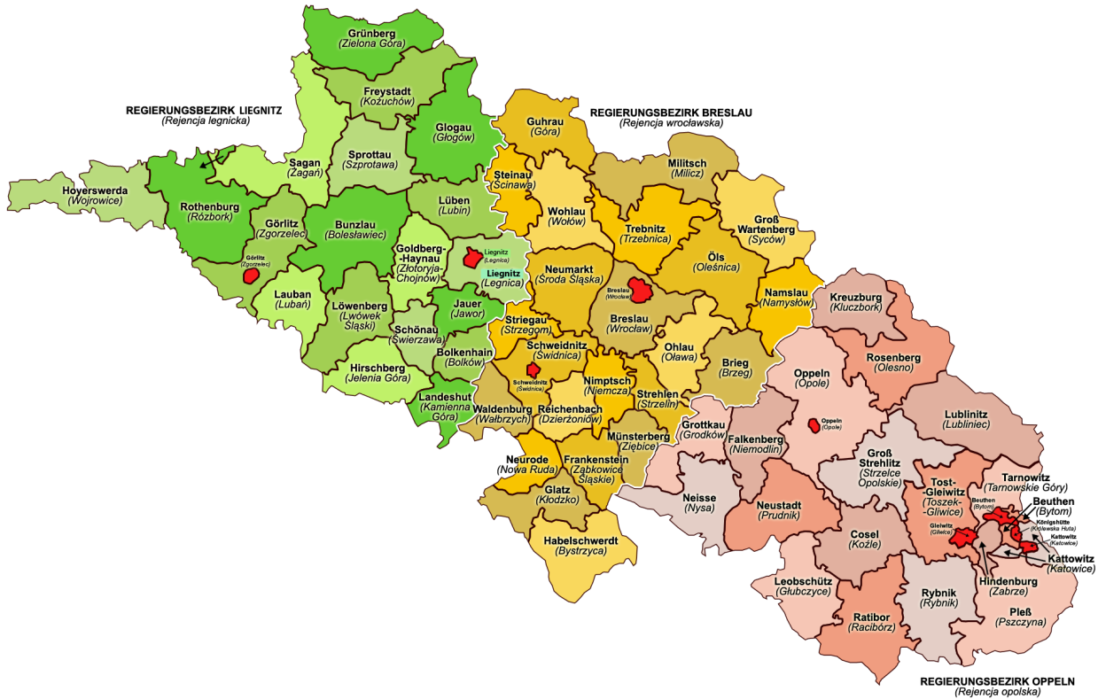
Karte 1: Provinz Schlesien, Königreich Preußen, administrative Gliederung, 1905

Quelle: http://en.wikipedia.org/wiki/File:Provnice_of_Silesia,_Kingdom_of_Prussia,_1905,_Administrative_Map.png ; Karte erstellt von »Qqerim«, mit kleineren Korrekturen durch die Redaktion der Polen-Analysen.