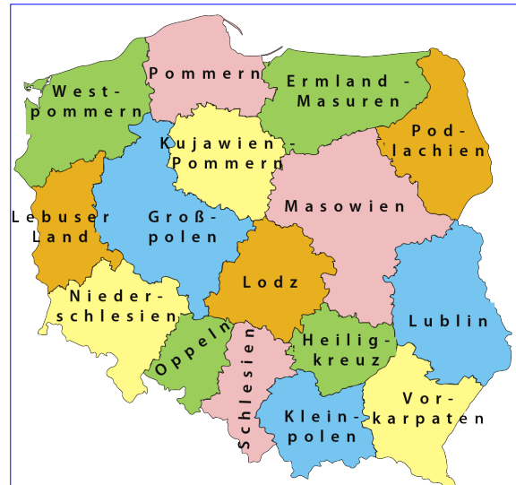
Karte 5: Die polnischen Woiwodschaften seit 1999